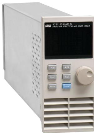
АКИП-1382/5 (модуль для установки в шасси)